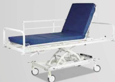
2-delt hvile og transportleje