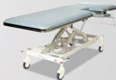
2-delt EKG leje