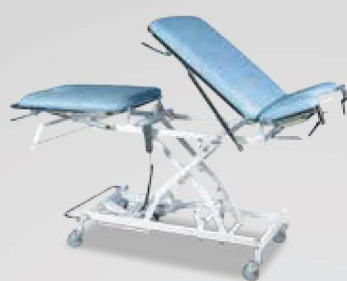
3-delt behandlingsleje på søjle