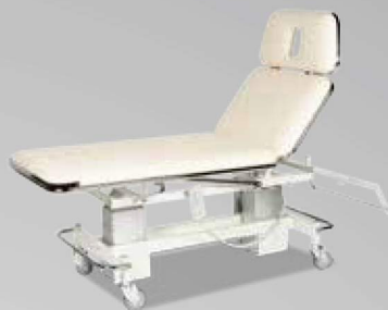
3-delt behandlingsleje på søjle