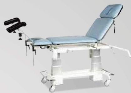
4-delt multileje på søjle