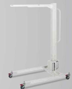
Ben & arm løfter